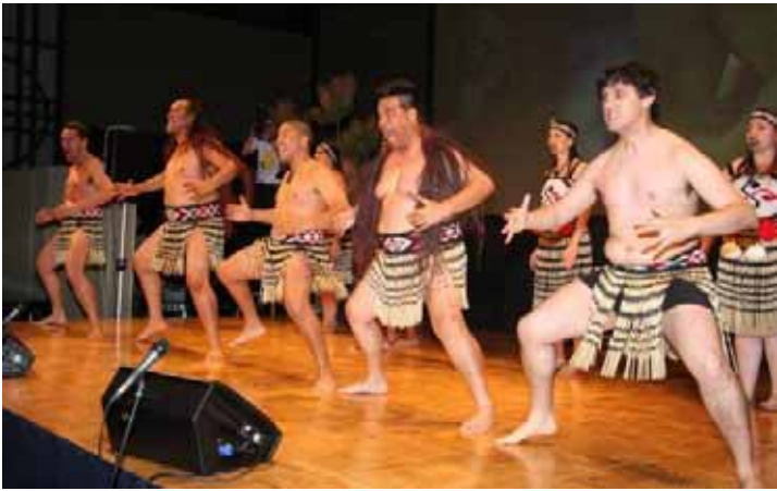
Nga Hau E Wha によるマオリパフォーマンス