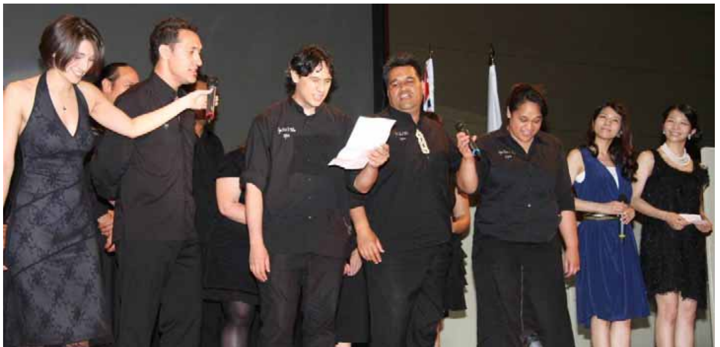
エンディングはアーティスト皆さんによる「We are the world」