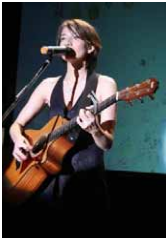
KATさんオープニング ライブ