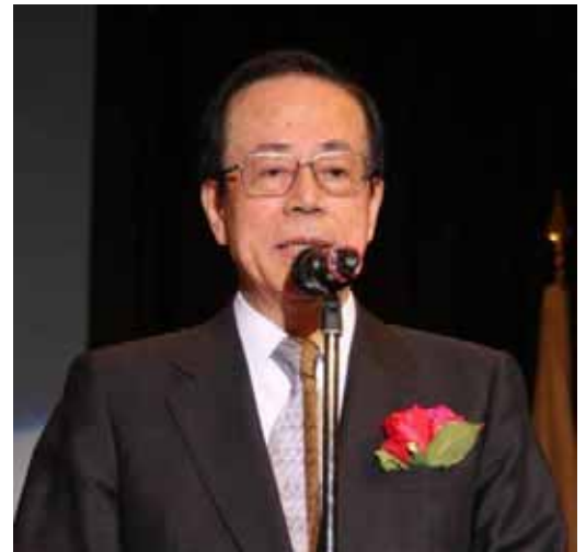
福田康夫元首相挨拶