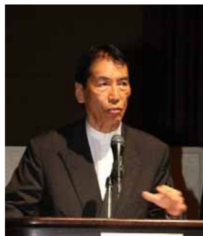
事務局よりチャリティー目的と寄附金使途を説明